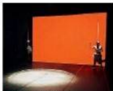
LENZ Boris Kadin.

di più generazioni, diversi in residenza proprio presso Lenz. E nel cuore della notte di giovedì è stato possibile vedere «Oresteia. Dystopian», ideazione e realizzazione, regia e scenografia del croato Boris Kadin, che all'inizio legge alcune frasi che scorrono sul fondo della sala, seduto a torso nudo di fianco agli spettatori, affermazioni sulla distopia che paiono connessioni irrazionali, si muove quindi dal computer al centro di una tonda faccia definita a terra con catene, si avvicina al pubblico, invita una giovane donna in scena in un dialogo segreto, e così via. Di qualche efficacia il momento in cui Kadin appoggia il volto alle maschere sospese ai lati del grande schermo.