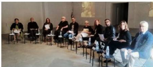
LENZ FONDAZIONE ieri la presentazione dei Progetti d'Autunno.

L'infinitamente grande e l'infinitamente piccolo i binari su cui corrono i Progetti d'Autunno che sono stati presentati ieri insieme alla Preview 2020 nella storica sede di via Pasubio