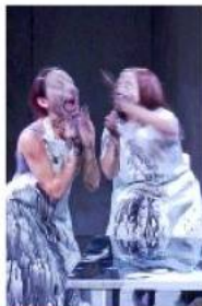
ORESTEA Una scena.

Sulla tomba di Agamennone, dove Oreste riscopre i suoi giochi, che anche Elettra e Ifigenia riconosceranno, rive-