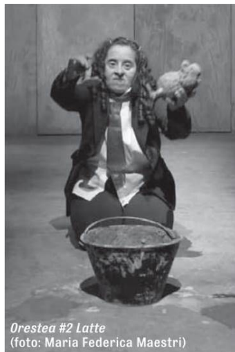
Oresteia #2 Latte