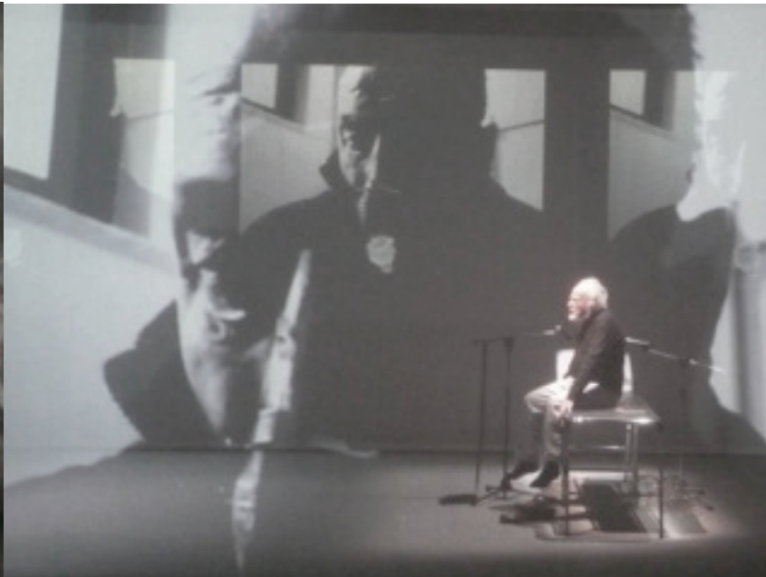
Immagini di Francesco Pititto

Il polmone s'arresta, il respiro si spegne, l'occhio abbandona i compagni, e il domani il mondo scompare, ripiega la vela il vento è finito. Il peggio per me è passato.