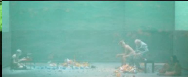
Immagini di Francesco Pititto

Escono i Sogni d'inferno per due porte; una è di corno, l'altra è d'avorio: manda il corno i veri, l'avorio i falsi; e per l'eburna Anchise diede (quando lor diè commiato alfine) a la Sibilla ed al suo figlio uscita. Enea verso le navi ai suoi compagni fece ritorno.